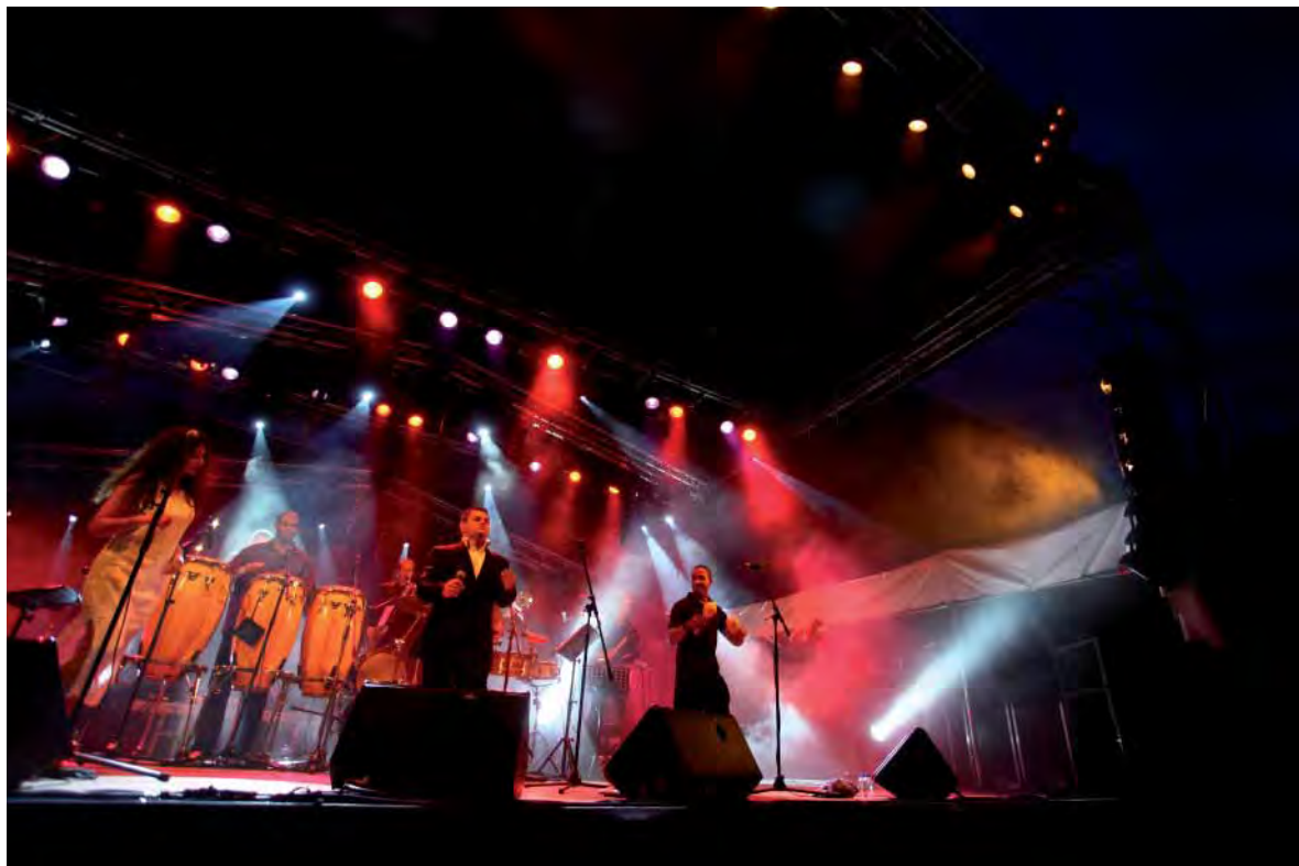
Chaque année, le Conservatoire participe à la fête de la musique.

Le Conservatoire n'a pas fini de surprendre. Le projet d'établissement se déclinera jusqu'à 2013. Il ne manque pas d'ambition.