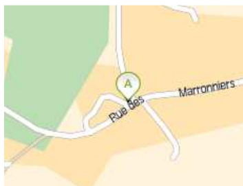
Figure 1 : exemple